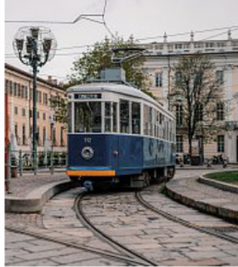
Anche sui tram storici si leggeranno poesie

digitale condiviso — e che vede la sinergia di più partner quali la Feltrinelli, Scuola Holden, Gallerie d'Italia, Fondazione per l'Architettura, Gruppo Torinese Trasporti e Associazione Torinese Tram Storici e Centro Nazionale Studi Leopardiani. Questa terza edizione — Poetry, the place to be — durerà una settimana, dal 21 al 27 marzo (che è anche la Giornata mondiale del Teatro), ed è dedicata ai luoghi come fonte d'ispirazione. Personalità dei mondi artistici e culturali si alterneranno nella lettura di poesie «in cui vorrebbero vivere», in diverse lingue di poeti e poetesse da tutto il mondo e di ogni epoca. I video saranno pubblicati sui canali Insta-